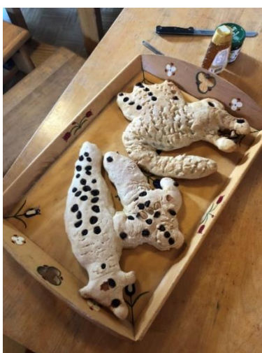
Kleuterklas; brooddraken Michaelsfeest