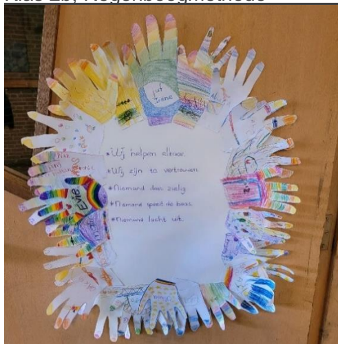
Klas 2b; Regenboogmethode