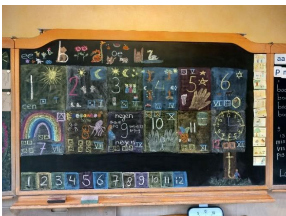
Klas 1b; getallen