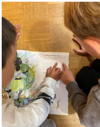
Klas 3b; boek cadeau ivm boekenweek