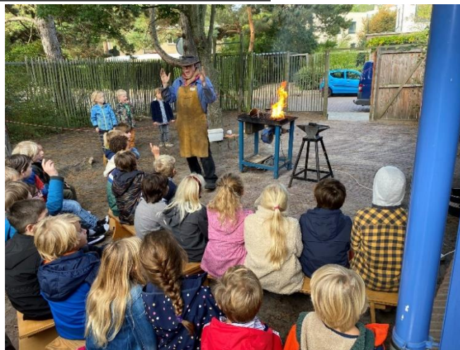
Klas 3a; Velo de smid in klas