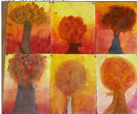
Klas 4b; Herfstbomen